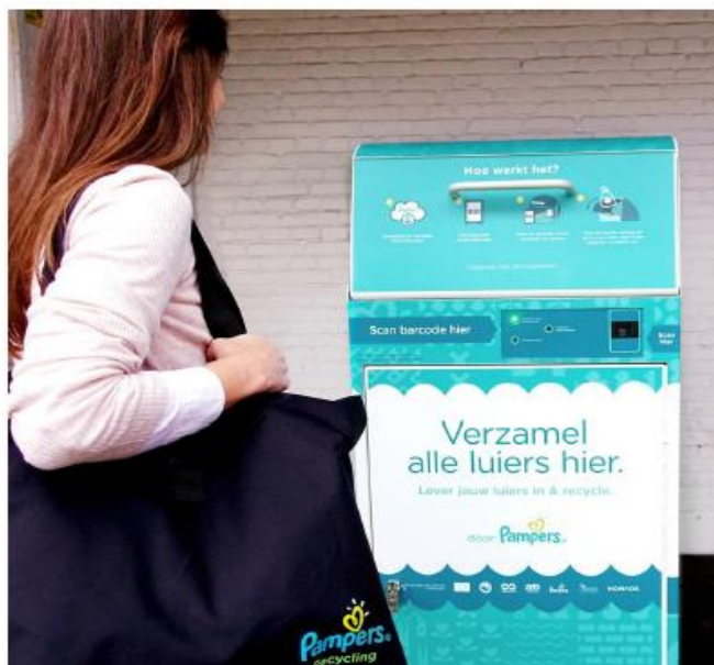
圖 2: Embraced 計畫在阿姆斯特丹的紙尿褲回收箱

7 TerraCycle 是美國的私人回收企業；AEB Amsterdam 是荷蘭的廢棄物處理公司；FaterSMART 是永續材料與回收技術公司，是 Fater 公司的子公司，Fater 是 P&G 與義大利工業集團 Gruppo Angelini 合資於義大利設立的公司。